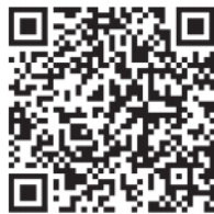
扫一扫，下载“爱下厨APP”