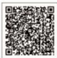
天猫精灵APP 下载天猫精灵享受智能生活

如您在使用过程中遇到任何问题，请联系九阳品牌售后电话 400-618-6999。