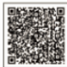
天猫精灵APP 下载APP请认准，避免被误导