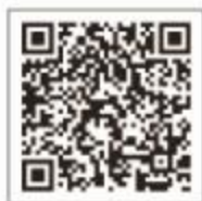
九阳微信公众号 扫码了解更多服务内容