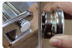
06 拔出旋钮旋转至1档 (最厚)