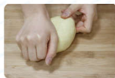
02 揉成面团 (面揉硬点更筋道)