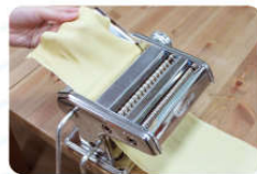
08 选择适合厚度压面皮 (参考档位说明)