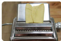
07 反复折叠挤压2-3次 (多压几次更筋道)