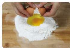
01 准备好食材 (建议面水比5:2)