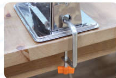
05 用固定架固定机器